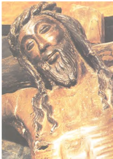
Rostro sonriente del Cristo de Javier.

La Iglesia en su anuncio no predica el mal ¡todo lo contrario! ¡Pregona la posibilidad de ser hombres y mujeres nuevos! ¡Transformados por el Espíritu! Pero debemos reconocer nuestra pequeñez, nuestras miserias, situarnos ante nosotros mismos para llenar nuestros vacíos con lo único que se puede llenar: Dios mismo, plenitud del ser humano. Sólo desde la fe llegamos a comprender realmente lo que significa ser persona y la grandeza de la vocación que Dios pone en nuestros corazones: “ Creer para comprender, comprender para creer ” (San Agustín).